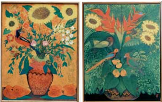
Jarro com Passaro Joanhina e Mangas Acrylique sur toile, 85 x 65 cm Jarro com Passaros, Heliconias e Fructos Acrylique sur toile, 90 x 70 cm