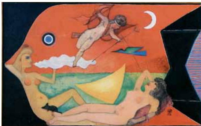
Pompéia II Acrylique sur toile, 69 x 110 cm