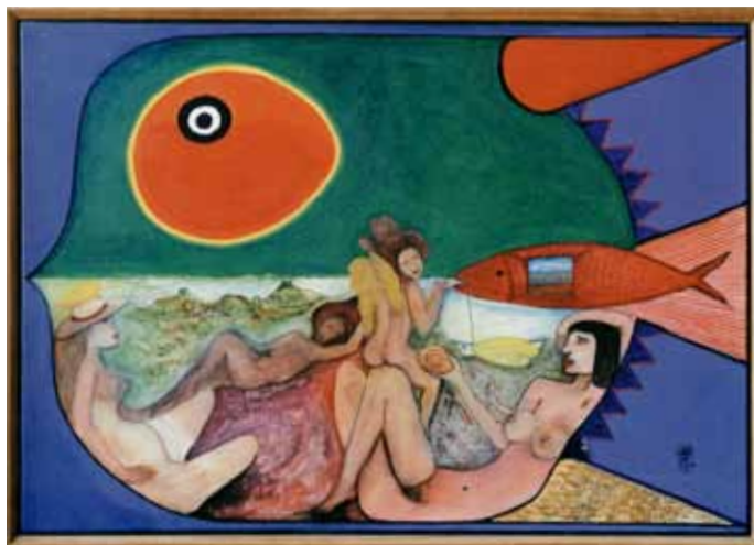
Gravidá Acrylique sur toile, 70 x 100 cm

Si ces poissons (Peixe 1, Peixe 2, Peixe 3) répudient toute notion de clair-obscur et affichent des aplats colorés pour revenir à une simplicité inspirée de Matisse, ceux de Gravidá et de Pompéia II deviennent gravides d'une scène que Barbosa décline à l'envi au fil de ses toiles et de ses dessins, où s'entremêlent personnages féminins hybridés d'oiseaux et de poissons, issus du bestiaire nordestin, symboles attribués aux divinités féminines du Candomblé, dont l'aventure picturale traduit un imaginaire fantasmagorique pour le moins fertile. Ici, l'automatisme psychique sollicité par le surréalisme se teinte d'une exubérance typiquement tropicale, héritée des topiques du Manifeste anthropophage publié par Oswald de Andrade en mai 1928, prônant un retour à la nudité et au matriarcat, à l'instar des indiens Tupi, comme pour bien