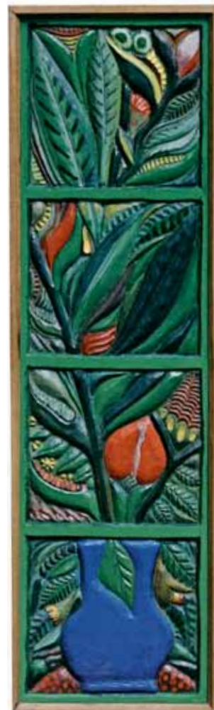
Janela, Vaso e Heliconias Bois polychromé 91,5 cm x 26 cm