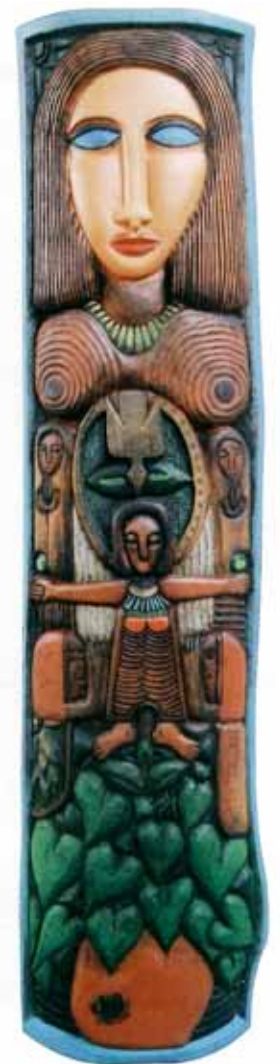
Madona Bois polychromé 118 cm x 29 cm x 6 cm