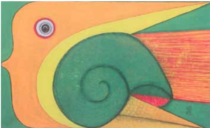
Peixe 2 Acrylique sur toile, 40 x 65 cm

Bénédicte Auvard Commissaire d'exposition