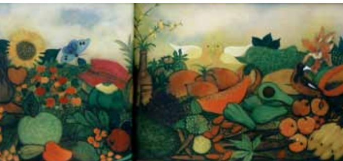
Fructos de Pernambuco Acrylique sur toile, 80 x 200 cm