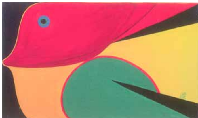
Peixe 1 Acrylique sur toile, 40 x 65 cm